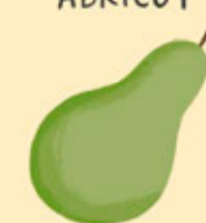
1 FRUIT DU TYPE POIRE