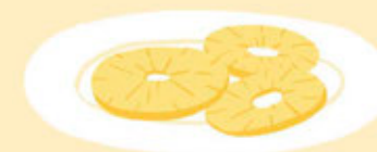
2 À 4 TRANCHES D'ANANAS (FRAIS OU AU SIROP)