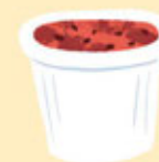
1 POT DE COMPOTE INDIVIDUEL OU 2 GROSSES CUILÈRE A SOUPE DE COMPOTE MAISON