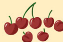
1 BONNE POIGNÉE DE PETITS FRUITS