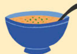
1 BOL OU ASSIETTE CREUSE DE SOUPE DE LÉGUMES