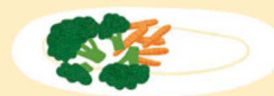
LA MOITIÉ DE 1 ASSIETTE DE LÉGUMES CUITS (ENVIRON 80g)