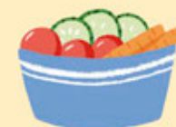
1 PETITE ASSIETTE OU 1 PORTION TYPE SELF-SERVICE DE CRUDITÉS (ENVIRON 80g)